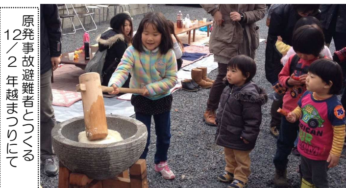
原発事故避難者として 12年越まつり CSJN

長岡京市では、今年9月から保育所、小学校の給食の放射性物質の測定をしています(12月13日の保育所給食から、規制値以下ですが放射性物質が検出されました)。向日市でもぜひ実施をと求めましたが、教育委員会は拒否しました。