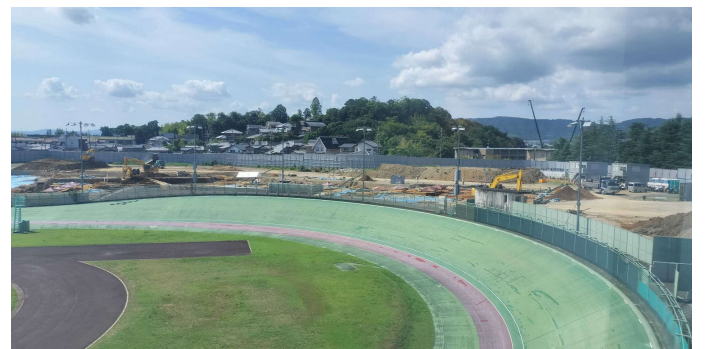
現地事務所より南側の住宅地方面を見る。アリーナの建物は、むこうの小山（元稲荷古墳）より高くなるそうだ