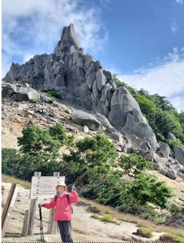
地蔵岳のオベリスクと筆者

途中で、下山してきた男性が突然私の目の前で倒れた。蜂に刺されて動けなくなったのだ。119番に初めて電話して救助